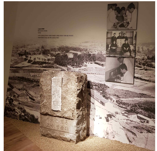
<역사관 수훈비 전시>