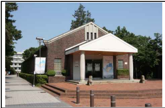
< 박물관 전경 >

서울시립대학교 박물관은 소중한 문화유산을 수집·전시하여 학생들의 교육활동을 지원하고, 시민들을 위한 문화공간으로 기능하기 위하여, 1984년 9월 4일에 개관하였다. 특히 서울시립대학교 박물관은 근현대 전문 박물관으로서 서울의 도시화 과정을 보여주는 자료의 수집과 전시를 전문으로 한다. 서울의 역사와 문화를 담은 특별전 개최, 조사연구, 유물수집 등을 통하여 학생 및 시민들에게 수준 높은 문화 서비스를 제공하고 있다.